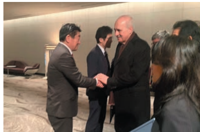
ヌマン・クルトゥルムシュ議長