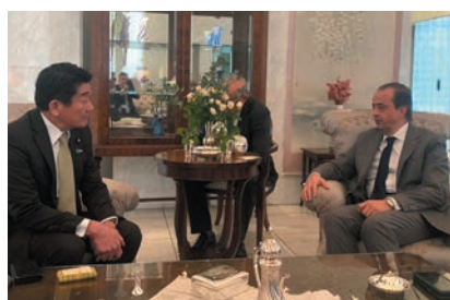
大使に川口の現状について話す

昨年の11月21日にコルクット・ギンゲン大使と面談を行いました。1月から新大使が着任されたとのことで、新大使にご挨拶の面談とともに意見交換。