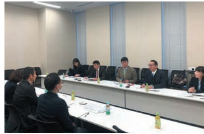
警察庁との意見交換

昨年に続き、有志で川口市選出の県議会議員、川口市議をお招きして、勉強会を実施しました。