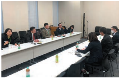
文科省との意見交換