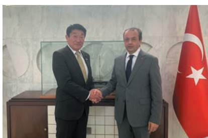
エルトゥール大使と