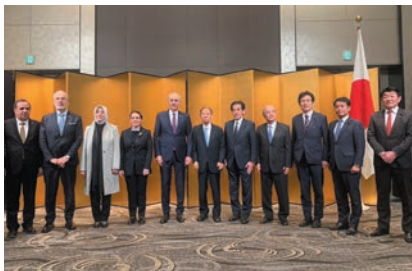
トルコからの議員団と